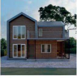
Double Storey House Model 1 Rs. 5,795,000 Rs. 6,100,000