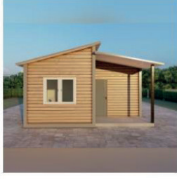
1 BHK Single Storey House Model 4 Rs. 1,769,836 Rs. 1,862,985