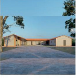
RP Panel School Building Model 1 Rs. 11,952,870 Rs. 12,581,968