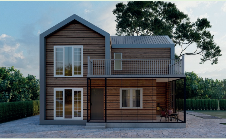
Double Storey House