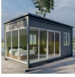
Container House Model 9 Rs. 874,158